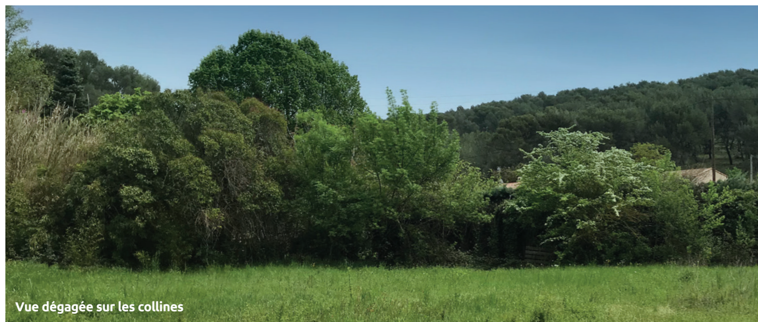
Vue dégagée sur les collines