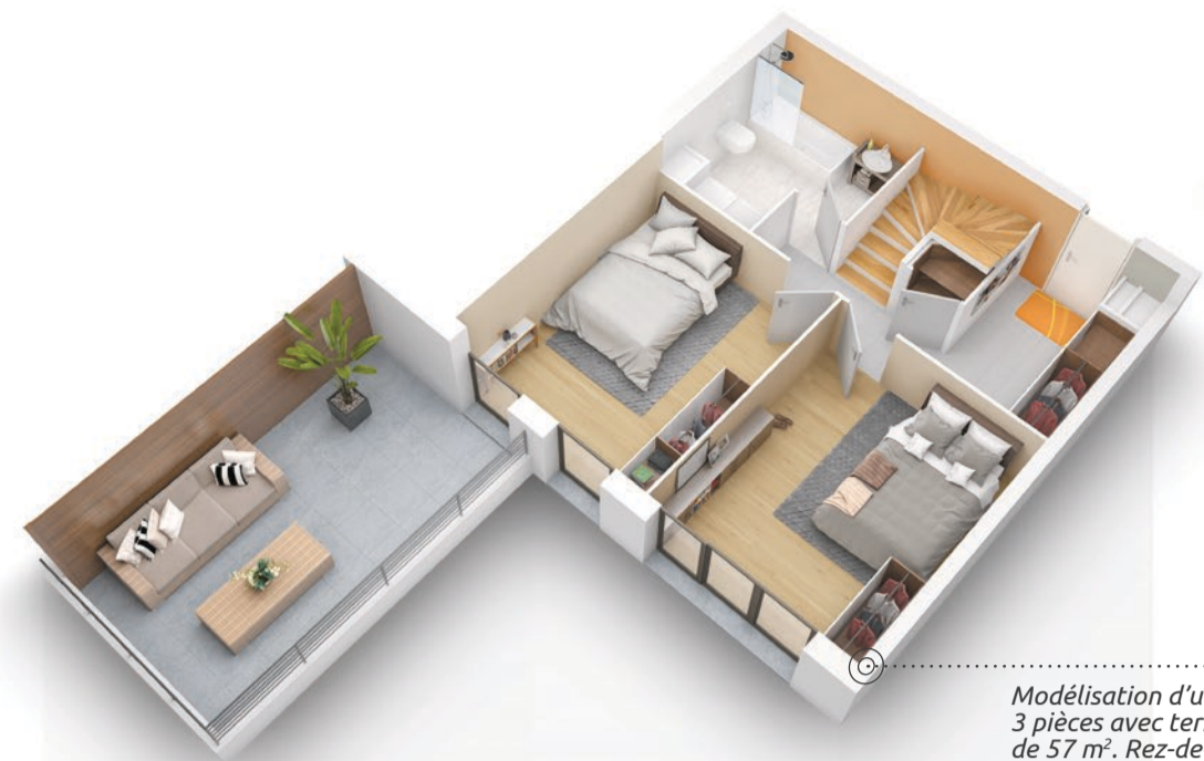
Modélisation d'un appartement 3 pièces avec terrasse et rooftop de 57 m 2 . Rez-de-chaussée.