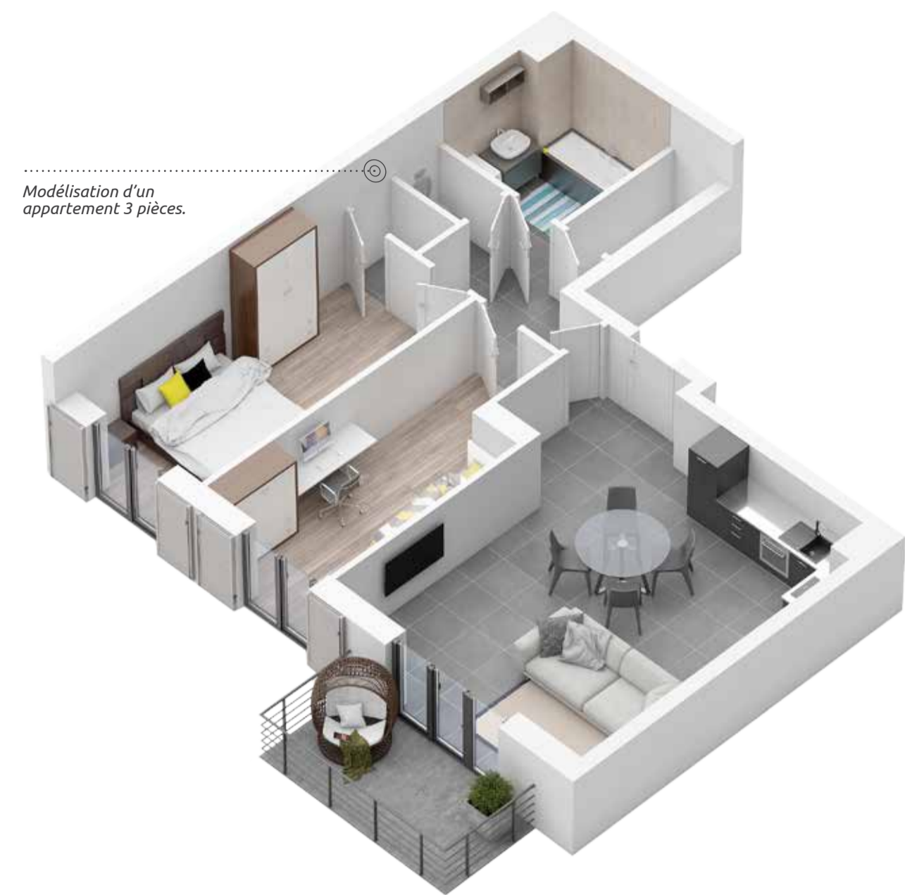
Modélisation d'un appartement 3 pièces.