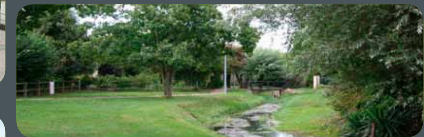
Quartier de Balory