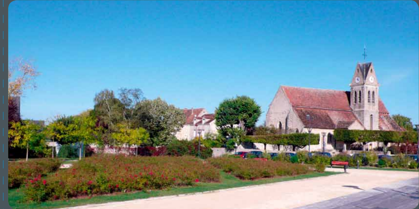
Vert-Saint-Denis : une commune accueillante au cœur de la nouvelle ville de Sénart.