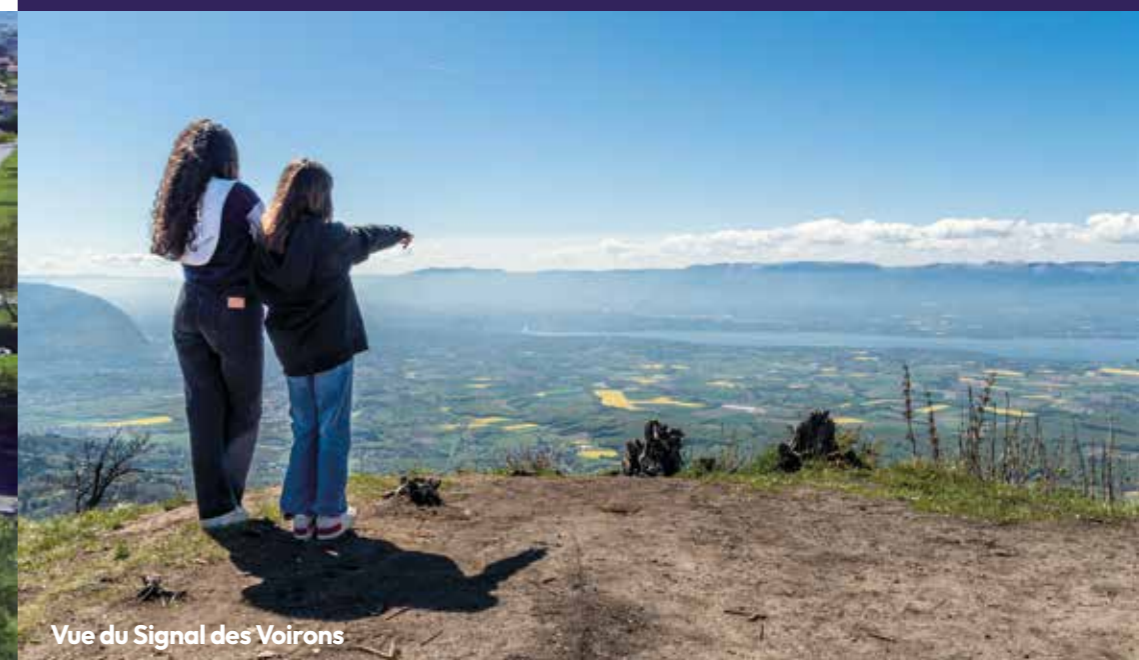
Vue du Signal des Voirons