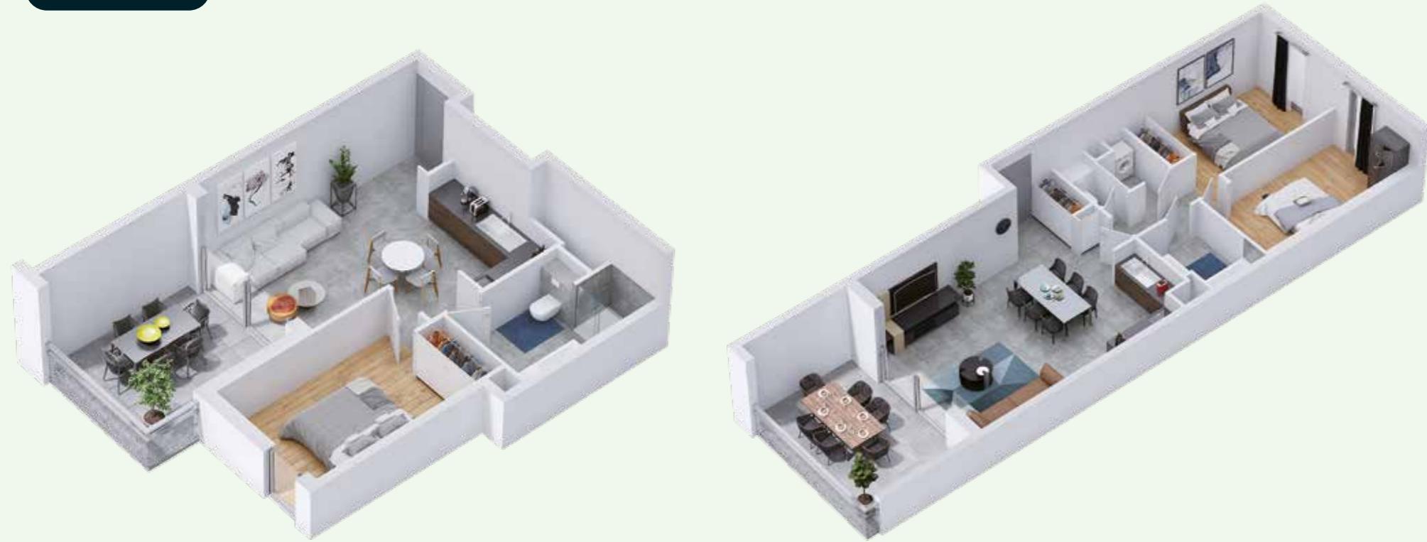
Modélisation d'un appartement 2 pièces de 39,70 m 2 avec terrasse.