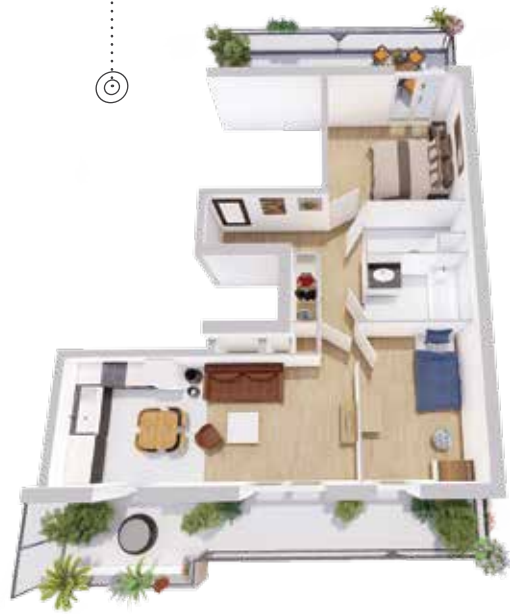
Modélisation d'un appartement 3 pièces avec 2 balcons