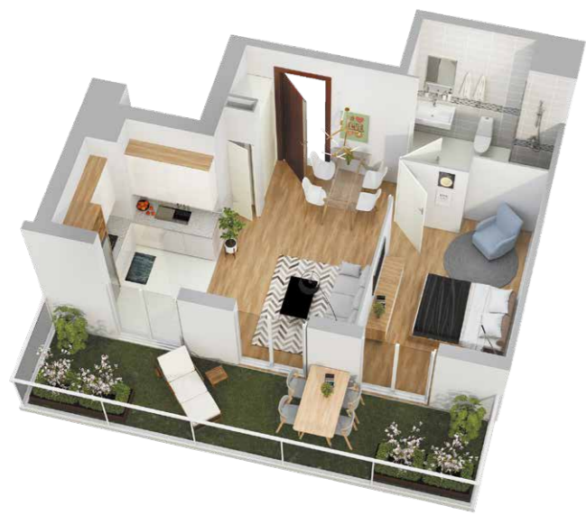
Modélisation d'un appartement 2 pièces avec jardin