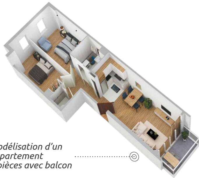
Modélisation d'un appartement 3 pièces avec balcon