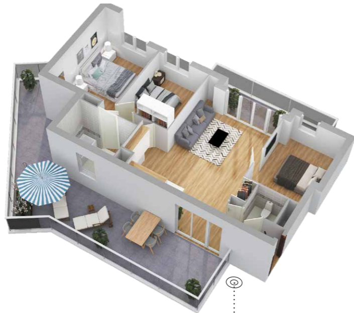
Modélisation d'un appartement 4 pièces avec terrasse de 40 m 2 et balcon