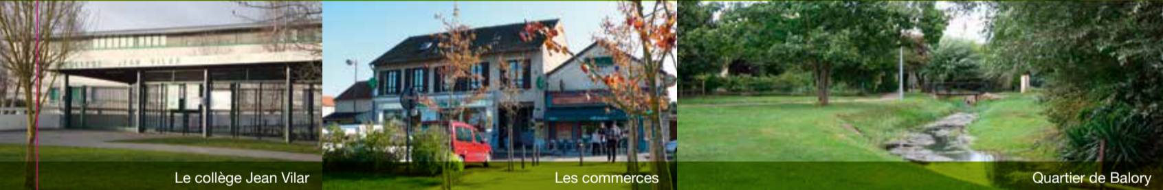
Le collège Jean Vilar