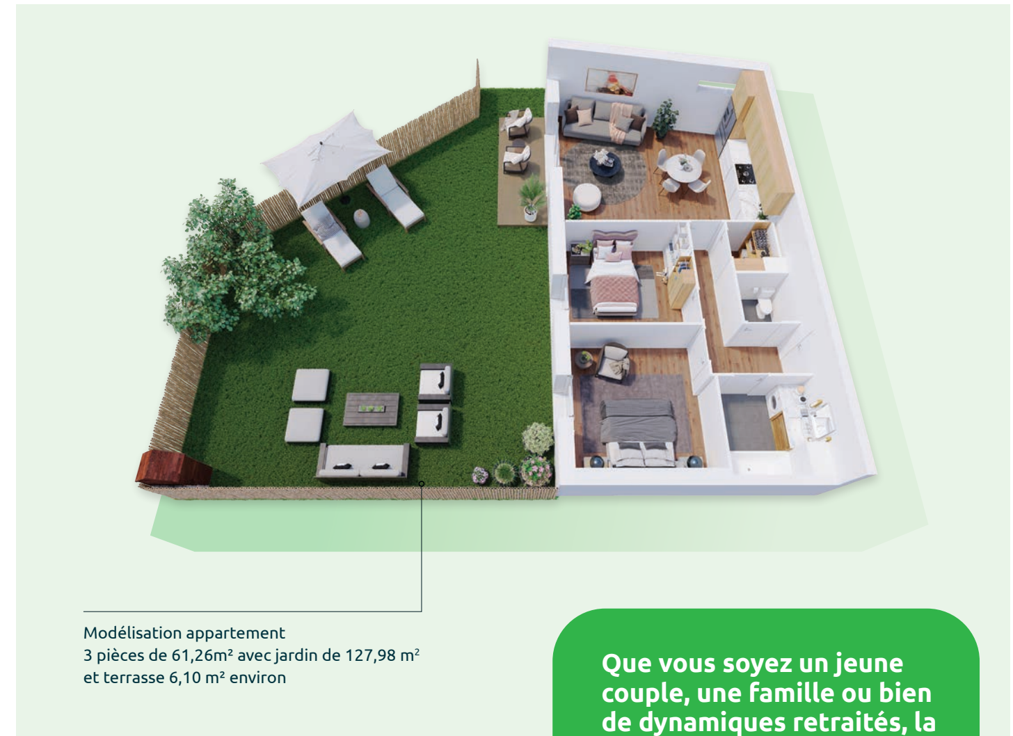
Modélisation appartement 3 pièces de 61,26m 2 avec jardin de 127,98 m 2 et terrasse 6,10 m 2 environ

Que vous soyez un jeune couple, une famille ou bien de dynamiques retraités, la Villa Élégance répondra à tous vos critères, pour un 1 er achat ou encore un investissement.