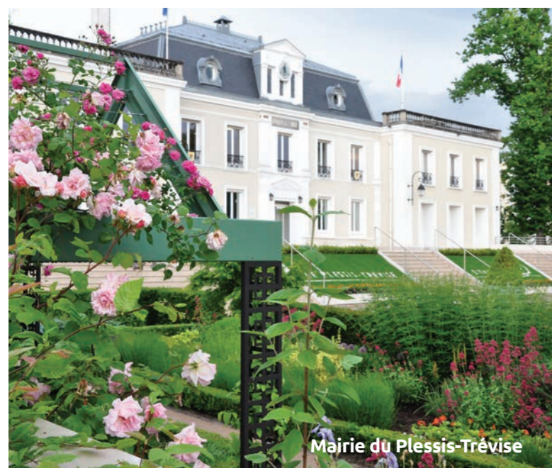
Mairie du Plessis-Tréville

Agréables extérieurs (jardin, terrasse ou loggia)